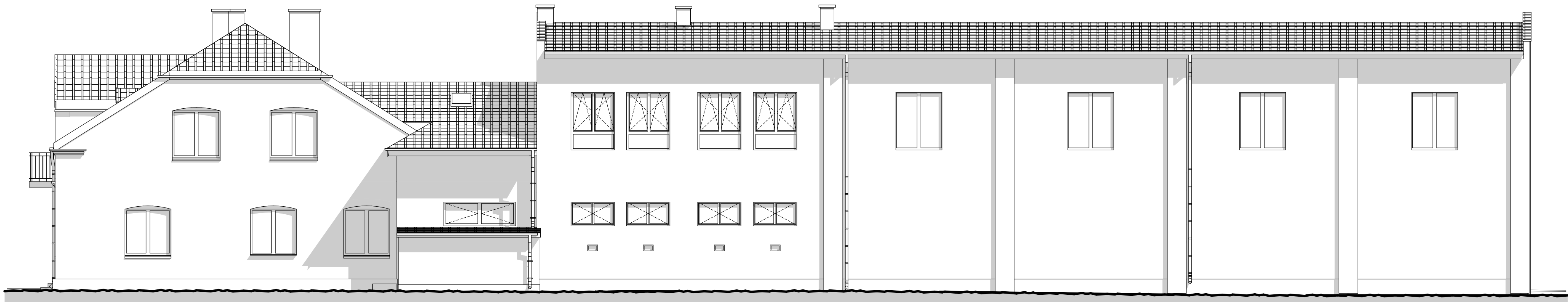
ELEWACJA POŁUDNIOWA - E6